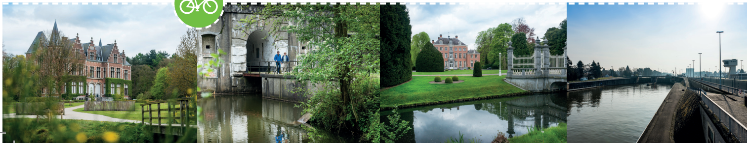
Sluizen van Wijnegem